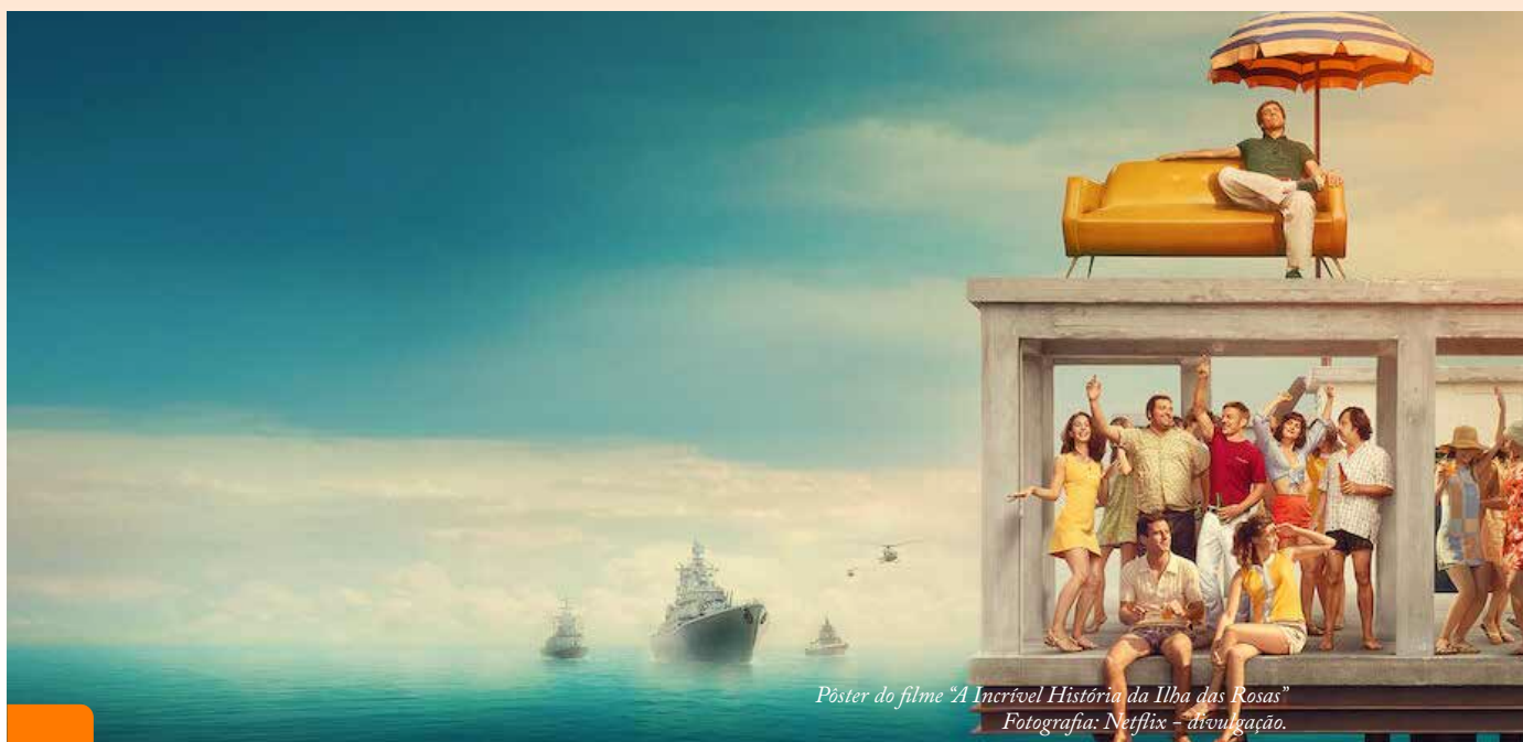
Pôster do filme "A Incrível História da Ilha das Rosas" Fotografia: Netflix - divulgação.