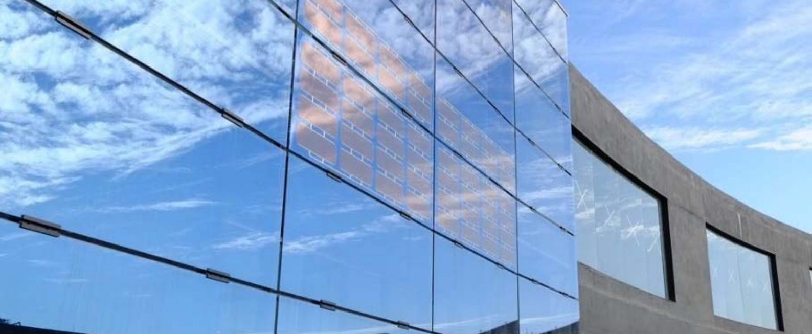
Foto: OPV aplicado no prédio da Inovalli em São Paulo. Projeto foi concluído no final de 2016.

os combustíveis fósseis. Em uma hora de insolação na Terra recebemos a energia equivalente à consumida no planeta em um ano. Como exemplo, com dois terços da área do lago de Furnas poderíamos gerar energia para todas as residências do Brasil. Assim podemos complementar a matriz energética com uma geração distribuída nas construções e elementos já existentes nas cidades, reduzindo assim a transmissão de energia em grandes distâncias, com as suas respectivas perdas. Porque não gerarmos energia nas fachadas de edifícios, mobiliários urbanos, galpões, carros e caminhões!? Um dos pontos cruciais para viabilizar essa geração de energia é o design. O filme fotovoltaico deve ser esteticamente bonito e fácil de integrar. Essa é uma das grandes vantagens do OPV (filme Fotovoltaico Orgânico) por ser leve, flexível e transparente. Além disso, o OPV é a forma mais verde de gerar energia a partir do sol, pois ele consome muito menos energia no seu processo de fabricação quando comparado com outras tecnologias.